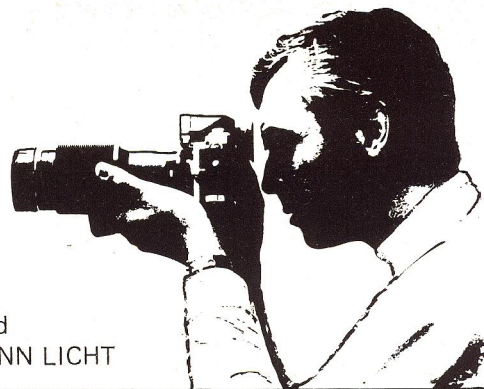
ved FINN LICHT